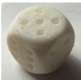
図 1 3D プリンタによる造形

3D CAD と CAE を用いてモデリングから 3D プリンタでの造形、静的応力解析のシミュレーションを行い、モデルの荷重に対する強度を調べることが出来た。使用した 3D プリンタは下から一層ずつ積み重ねる熱溶解樹脂積層造形法を採用しているため、図 1 のようなサイコロの場合は一層ずつ重ねる積層が行われており、最後まで樹脂が途切れずモデルを造形する事が出来た。一方、丸みのあるパイプ棚や鉄道車両のような細かい形状の造形は難しく、ノズルから出る棒線上の樹脂が途切れる問題が発生する。そのため、一括で造形するのではなく部品一つ一つを個別に作製して造形し、組み立てる必要があることが分かった。次に静的応力解析では 123D Design と Fusion360 という異なるソフト間でも SAT データがあれば点や線、面、立体を相互に利用出来た。また、パイプ棚に荷重を掛けたとき、変形が起きにくいように強度を上げるためには、材質を変えるだけでなく、b のパイプ棚のように取り付け部分の幅を広げて強度を高めて変位量を小さくし、モデルの構造を工夫して応力を緩和させることで、構造強度が上がる事が分かった。