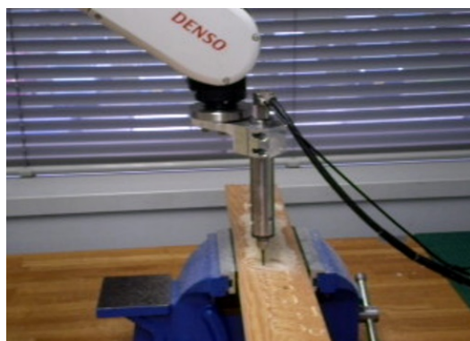
Fig. 2 Machining scene of outline fonts using industrial robot VS068 with the proposed CAD/CAM interface.

ORiN は、同一のアプリケーションソフトウェアが異なるメーカー、バージョン、ロボット、NC 工作機械などの制御装置の情報を共通的な方法でアクセスできる標準化のための通信インタフェースであるが、現時点では具体的なアプリケーションが少ないという問題がある。開発には ORiN ミドルウェアが提供する API 関数群が含まれる CAO(Controllor Access Object)と呼ばれる開発用インタフェースを用いた。CAO に含まれる多くの関数を検証し、その中からアーム先端の位置・姿勢情報をモニターするための関数である CaoGetPose と、実時間でサーボ系に目標の位置・姿勢情報を与えることができる関数である CaoMove を用いてダイレクトサーボと呼ぶコントローラを開発した。